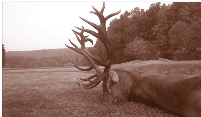
Szentpéterföldre – ZALAERDŐ Zrt.