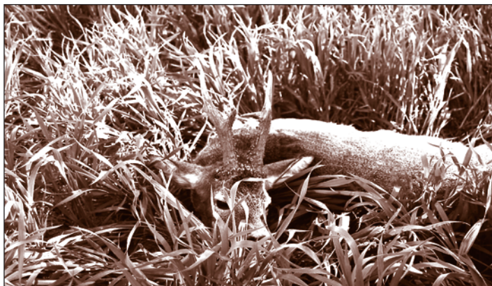
A magyarszerdahelyi nagy bak