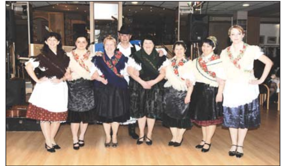
Az idei Diana Bálon zalai népviseletben köszöntötték a résztvevőket a hajdú Dianák.