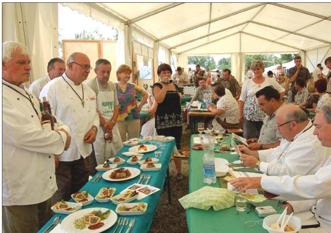
A Hubertus Vadásztársaság menüsorát bírálja a zsűri az országos vadásznapon.

A zalai vadászoknak bizonyára nem kell bemutatni a bürrüt, amit a nyelvészek tájszónak neveznek. Joggal, mert valóban az; a dunántúli tájegység megyéiben, főleg Zalában ismert. Mindazonáltal megyénkben is előfordul csodálkozás a szó hallatán, melynek jelentése: gyaloghíd: árkon, patakon átjárás végett keresztültett deszka, palló. A szó azok fülébe cseng vissza ismerősen, akik mindennap találkoznak „jelentésével”. Ők a vadászok, akik járva az erdőt gyakran bürrükön – hidacskaikon – kelnek át. A Zala Megyei Vadászkamara és a Zala Megyei Vadászszövetség lapja elnevezésében ezt a helyi hagyományt kívánja megőrizni, utalva a két szervezet a vadászok társadalmában betöltött összekötő, érdekvédő szerepére.