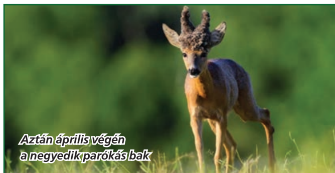
Aztán április végén a negyedik parókás bak

a legnehezebb feladat, hisz a baknak el kellett távolodnia a kerttől megfelelő távolságra, hogy a lövést kifelé biztonságosan leadhassuk. Miután elsétált a kertektől az erdő irányába utána cserkeltünk, és 150 m-ről újtárra engedtuk a golyót. A bak tűzben rogyott és hozzá lépve szembesültünk vele, mekkora tömeget is rakott fel az utolsó fotó óta.