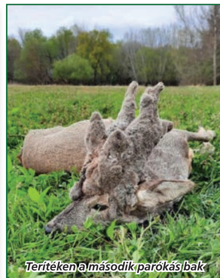
Terítéken a második parókás bak