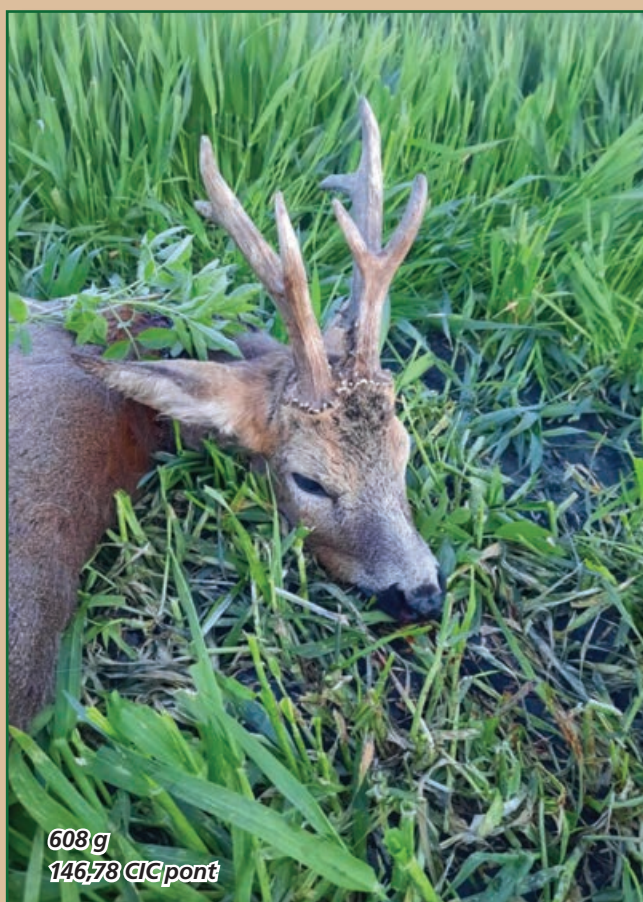
608 g 146,78 CIC pont