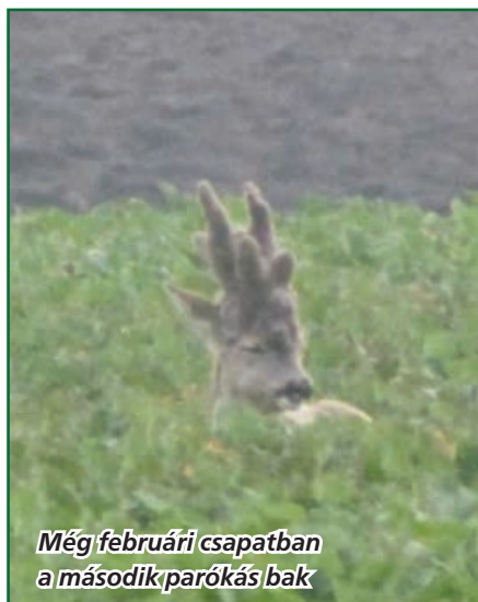
Még februári csapatban a második parókás bak