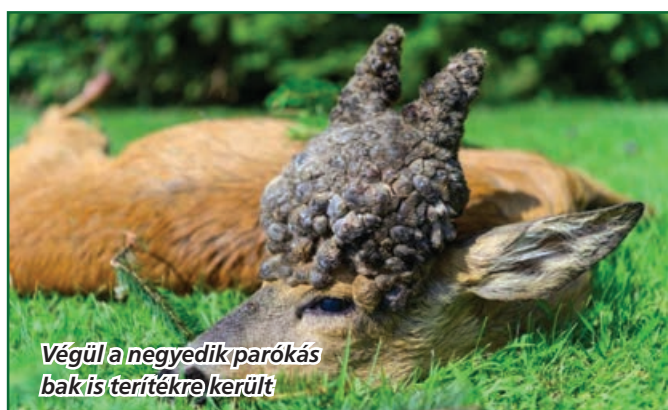
Végül a negyedik parókás bak is terítékre került

a legnehezebb feladat, hisz a baknak el kellett távolodnia a kerttől megfelelő távolságra, hogy a lövést kifelé biztonságosan leadhassuk. Miután elsétált a kertektől az erdő irányába utána cserkeltünk, és 150 m-ről újtárra engedtuk a golyót. A bak tűzben rogyott és hozzá lépve szembesültünk vele, mekkora tömeget is rakott fel az utolsó fotó óta.