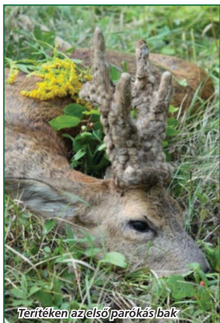
Terítéken az első parókás bak