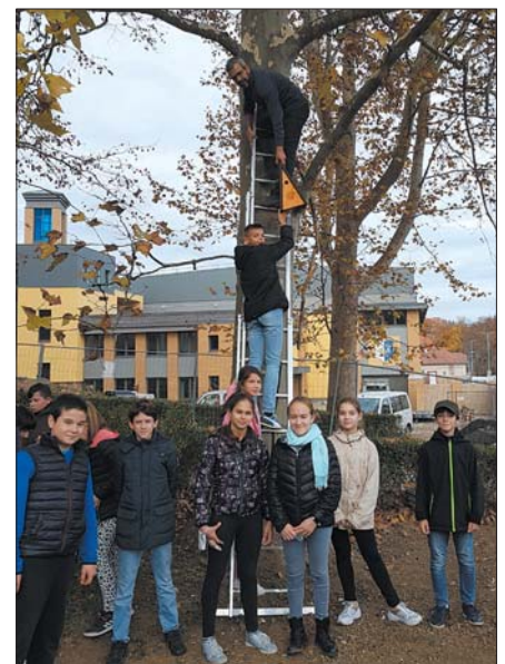
A zalaegerszegi Mindszenty-iskolában is helyeztek ki madárodúkat