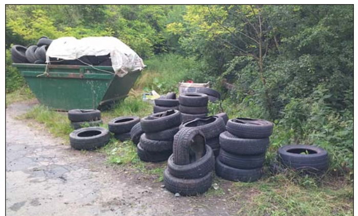
Az összegyűjtött hulladék egy része