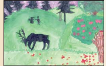
A 2020. évi rajzpályázatunk néhány inspiráló alkotása

A maximum A4-es méretű alkotások készítésénél az eszközök kreatívan használhatók. A hagyományos festészeti, rajzolásai módokon kívül, a környezettudatosság jegyében csomagoló papírok, fonalak, magok, termések, gyöngyök, ruha- és műanyagok stb. újrahasznosításával készült pályaműveket is várunk.