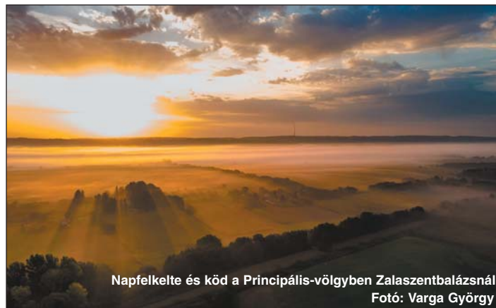
Napfelkelte és köd a Principális-völgyben Zalaszentbalázsnál

lesre, ahová megbeszélték a találkozást. Mikor megláttuk a lest, lassan odalopóztunk, majd felmentünk. Nagypapám még nem ért oda, de már láttuk, hogy a nyiladékon jön és nagyon távcsövez befelé a zabba. Mi is arra néztünk, amikor egyszer csak egy agancspárt láttunk kikandikálni a zabból. Közbe Nagypapám is felért a lesre. Már együtt távcsö-