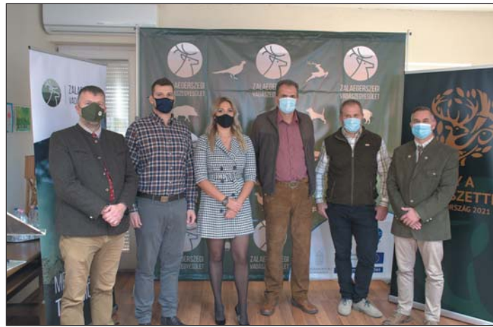
A konferencia előadói

magáénak tudhatja Közép-Európa legnagyobb vadászati múzeumát. Itt felbecsülhetetlen értékű kiállításanyagot láthatunk, többek között Ferenc József császár dédnokájának, Windisch-Grätz Ferenc József hercegnek és Hidvégi Bélának (aki első európai vadászként kapta meg a Pantheon-díjat) köszönhetően.