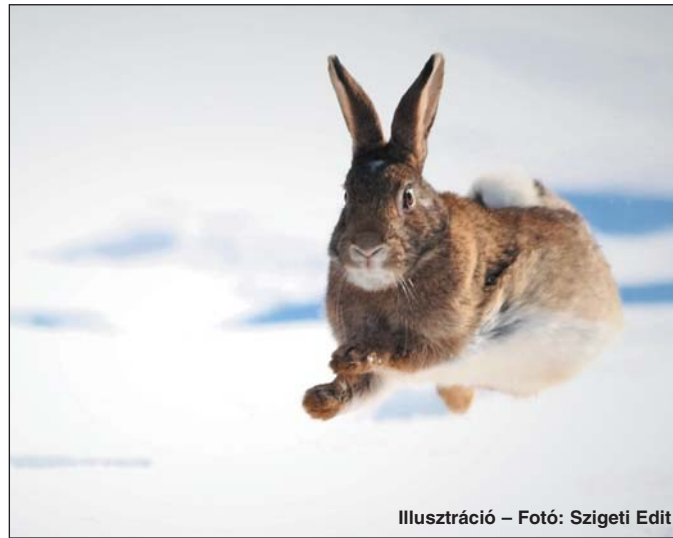
Illusztráció – Fotó: Szigeti Edit

Bár a termék fejlesztése során elsősorban arra törekedtünk, hogy a nyúl és az őz általi károsításokat