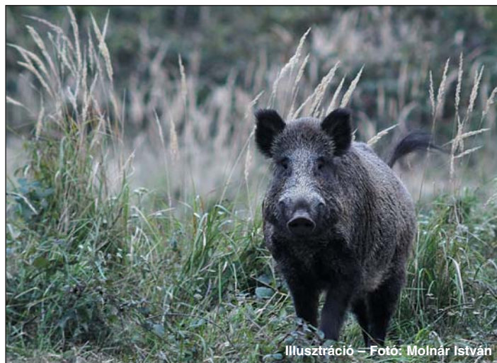
Illusztráció – Foto: Molnár István

A 2020. január közepén megtartott értekezlet a megjelentek számát, továbbá az elhangzott