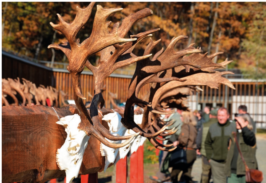
Különlegességekben sem volt hiány