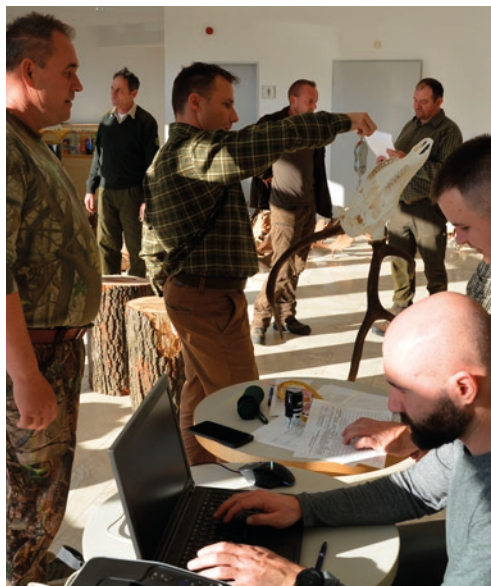
A gímrika trófeájának bírálata