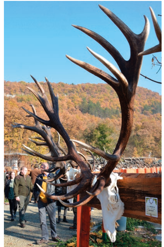
A legnagyobb trófeasúlyú bika 12 kiló volt, a Bagolyirtás Vt. területén lőtték