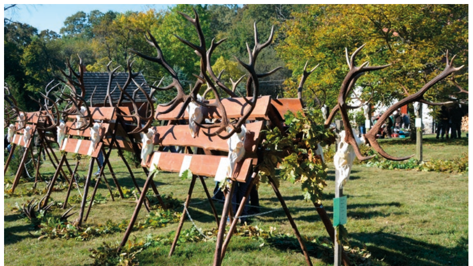
Csaknem száz tróféát láthatott a közönség