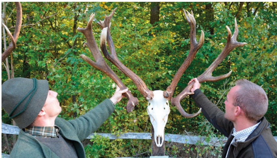
Néhány trófea esetében az előző évi hullajtott agancspárokat is láthatták az érdeklődők