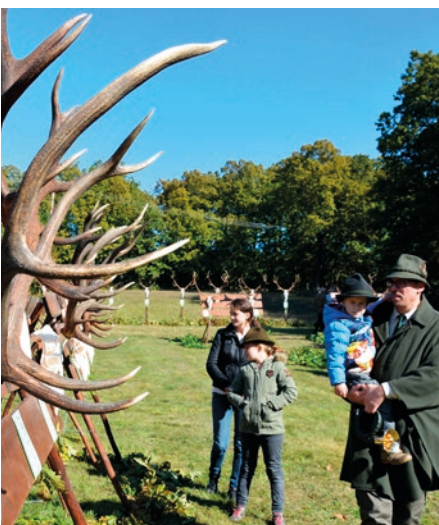
Bőven volt látnivaló a Szilos udvarán