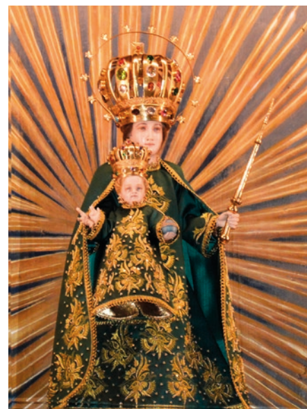
Szentkúton zöldbe öltöztették a bazilika kegysozobrát

– A vadgazdálkodás fejlődését jól jelzi, hogy az 1901-es, a történelmi Magyarország adatait tartalmazó kimutatás szerint Nógrád vármegyében 135 gímsharvast ejtettek el. Most a szentkúti szemlére 136 gimbika trófeáját hozták el a vadászatra jogosultak.