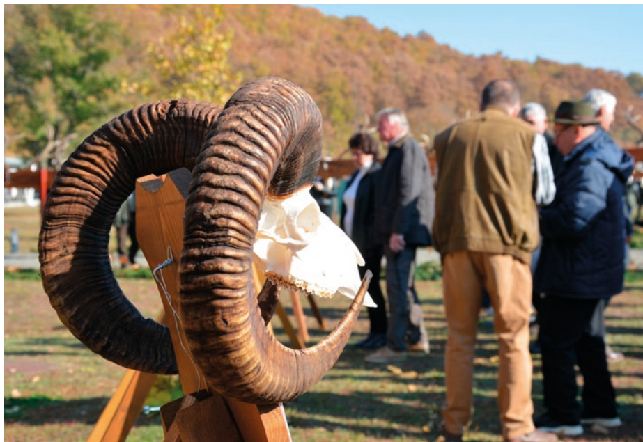
Aranyérmes mufloncsiga is színesítette a trófeamustrát