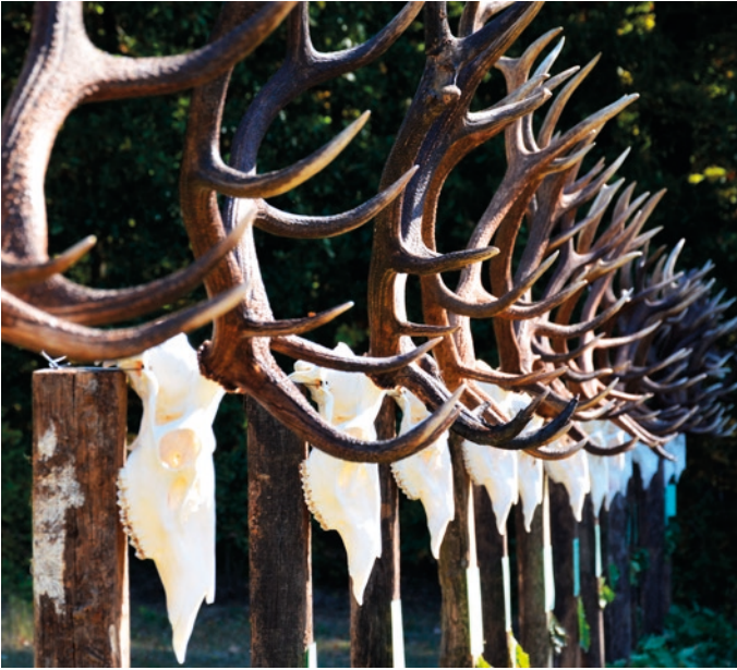
Golyóérett bikák tróféáinak sora