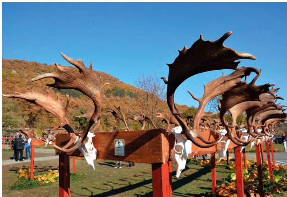
Dámtrófeák a szentkúti mustrán