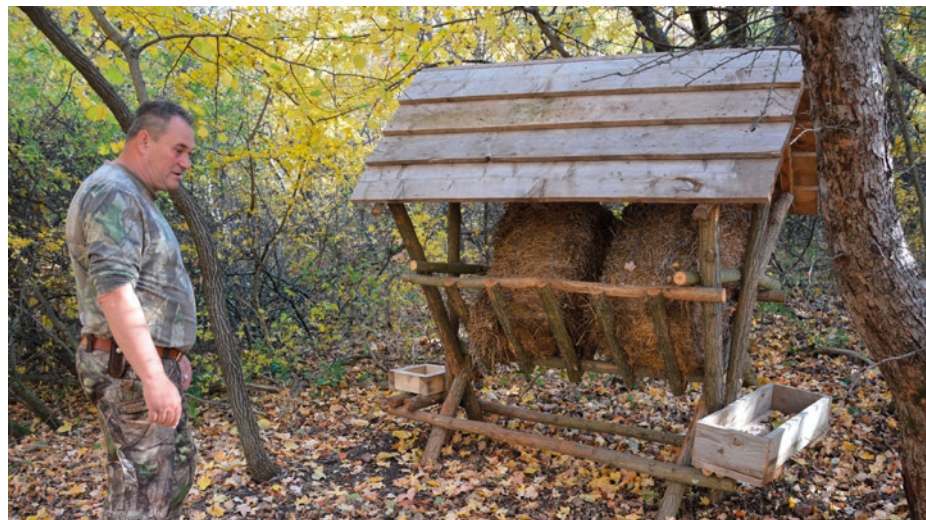
Özetető a kert végében