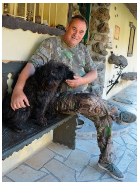
Négy lábú kedvencekkel a tornácán

A hivatásos vadász a Pásztóhoz tartozó Muzslapusztán él, lapunk utoljára 2017 nyarán járt itt az egyik helyi általános iskolás diákoknak tartott helyszíni előadásán. Azóta számos fejlesztést megvalósított a félhektárnyi, arborétumszerű területen és környékén, amikor a járványhelyzet nem akadályozta, táborba is várta ide a természet, a múlt és a helytörténet iránt érdeklődő fiatalokat.