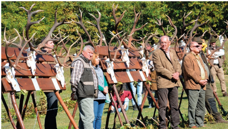
Számos érdeklődő felkereste a rendezvény helyszínét